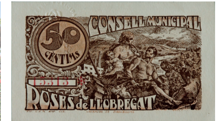
Vista del parque del Roserar y billete de 0,50 pesetas de Roses de Llobregat.