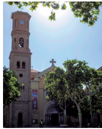
Catedral de Sant Llorenç, en la plaza de la Vila.

Chimenea de Can Samaranch, en el pasaje Carniser, en el barrio de Falguera.