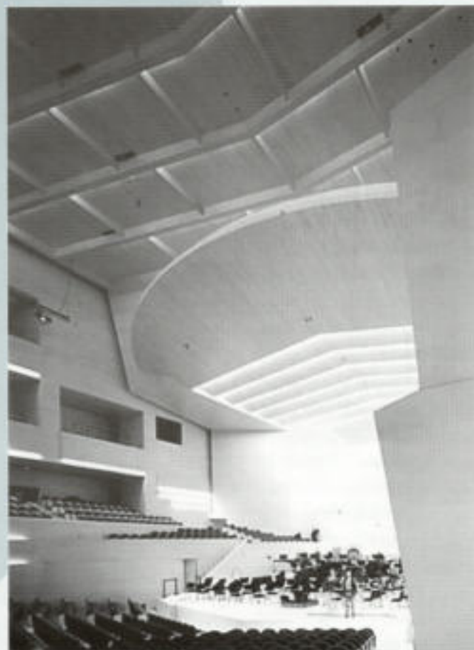
A la part superior de la pàgina, l'escenari de ContraBaix, cicle de jazz de Sant Feliu. Sobre aquestes línies l'escenari de l'Auditori