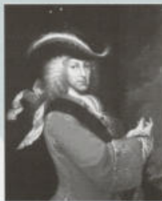
Fotografia superior, retrat de Carles III. Fotografia inferior, Felip V

Reyno se actúe y enseñe en lengua castellana. (...) todas qualesquier resoluciones, o estilos, que haya en contrario, y esto mismo recomendará el mi Consejo a los Ordinarios Diocesanos, (...) mando, que la enseñanza de primeras Letras, Latinidad y Retórica, se haga en lengua castellana, ...." L'any 1770 manà als virreis de Perú i Nueva Granada, "... que de una vez se llegue a conseguir el que estingan los diferentes idiomas, de que se una en los mismos dominios, y sólo se hable el castellano, como está mandado....".