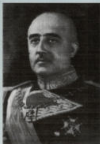
Fotografia superior, Alfons XIII, al mig Francisco Franco i fotografia inferior el rei Joan Carles I (fotografia oficial)