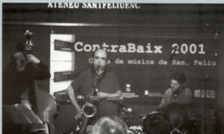
Imatges d'un dels darrers concerts de ContraBaix, organitzats entre els Amics de la Música de l'Ateneu, Joventuts Musicals i l'Ajuntament de Sant Feliu.

Sembla que la gallineta del sector musical ha dit que no . També el del teatre va pel mateix camí. Després d'una primera etapa de reconstrucció, podria ser un bon moment per al debat, la reflexió i la planificació conjunta entre tots els agents implicats en la cultura al nostre país. Nosaltres com a exemple dels fruits d'aquest debat i del treball conjunt podem oferir els resultats de ContraBaix.