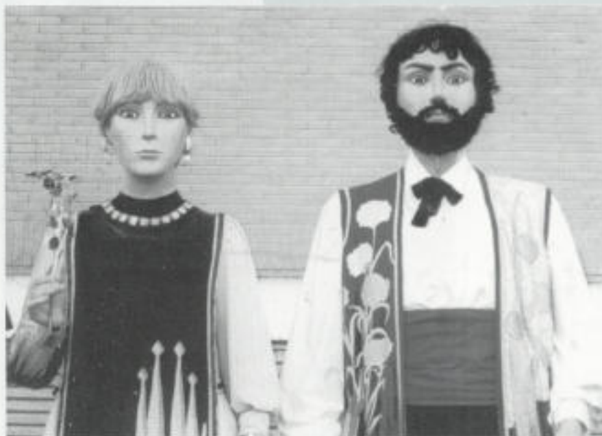
Els Gegants de Catalunya, en Treball i na Cultura

Però el gruix d'actes es portaran a terme el cap de setmana del 26 i 27 de maig, quant Sant Feliu es vestirà de gala per a la celebració d'aquest important esdeveniment a la nostraciutat. El divendres dia 25 ja es començaran a acollir les colles geganteres que vénen de més lluny per participar en la Ciutat Geganterera i el dissabte 26 es farà la recepció oficial dels Gegants i Gegantons que donen significat a aquesta festa.