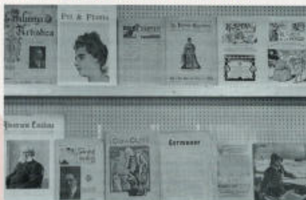
Exposició amb algunes publicacions de finals de segle passat

Així doncs, la creixent globalització de la comunicació no sembla que hagi de comportar una minva del seu estat de salut, sinó al contrari. L'arribada de l'era digital està estimulant l'aparició i consolidació d'experiències de premsa local. I fins i tot jo diria que la riquesa de la vida local es podrà veure reforçada per les possibilitats que ofereixen les TIC. I així, un dia un ciutadà de Sant Feliu podrà llegir a Internet, des del seu hotel de vacances a Bali o des del seu telèfon mòbil a Orense, el que va passar al darrer ple municipal, o veure les fotos de l'exposició del drac a Can Ricart o escoltar una entrevista amb el cap de colla dels castellers de Sant Feliu. I això passarà molt aviat. Ja ho veureu.