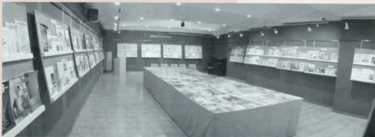
Amplia panoràmica de l'exposició, més de 600 exemplars.