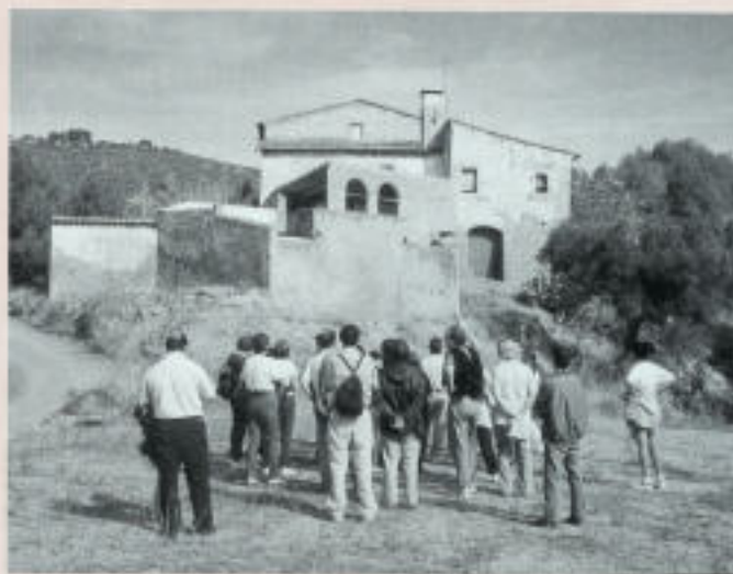
Fotografies de grup a la sortida de difusió del patrimoni local

A la ciutat visitem can Maginàs reconvertida en centre de formació, can Dot salvada in extremis i can Llobera. Totes elles tenen assegurada la supervivència perquè la trobada d'un ús garanteix la seva pervivència, en aquest univers de la postmodernitat, on res subsisteix si no serveix. Arribem a can Bertran, és tard la jornada ha estat intensa, i la descoberta d'aquesta història associada als edificis s'endevina irrenunciable per als nostres assistents. Més enllà d'una visita turística es demana més i més informació, i conservació, de la manera que sigui, és molt el que s'ha enderrocat en èpoques passades.