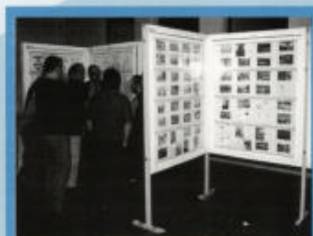
A les passades Festes de Primavera, del 6 al 9 de maig el Cercle Català del Col·leccionisme es va presentar amb una exposició de filatèlia al pati interior de l'Ateneu

D'altra banda, tenint en compte la Llei municipal catalana del 9 d'octubre de 1936, els ajuntaments varen obtenir la base legal per a resoldre el problema de la falta de diner fraccionari dintre del seu terme municipal, i així poder emetre paper-moneda, de petit valor, sota determinades obligacions i garanties.