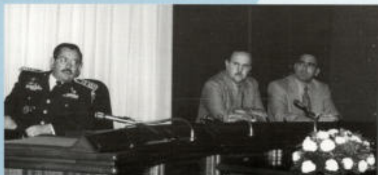
En Joaquim Fernández amb el Ministre de Defensa de Guatemala, el General Marco Tulio Espinosa