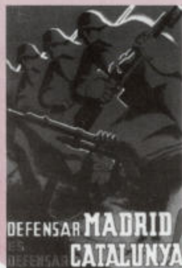
Cartell editat a l'època utilitzat en el tríptic de l'activitat

Aquesta activitat va ser possible gràcies a l'esforç conjunt de la Secció de cinema - vídeo, el Grup de la gent gran, el Centre d'Estudis Comarcals del Baix Llobregat i l'Agrupació de Recerques i Estudis de Sant Feliu.